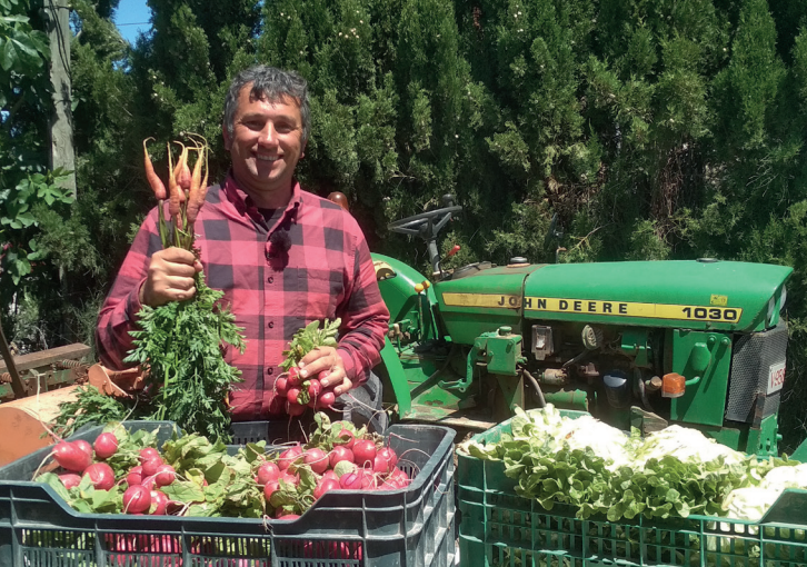
Ell ha cursat estudis d'Enginyeria Agronòmica.